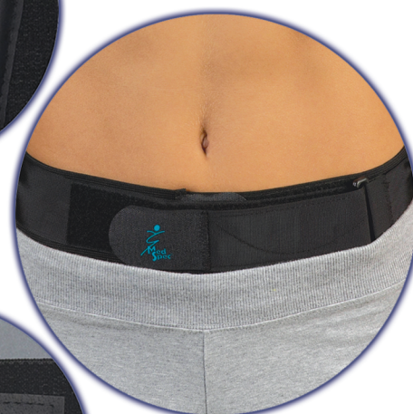
Peut être portée en contact direct avec la peau