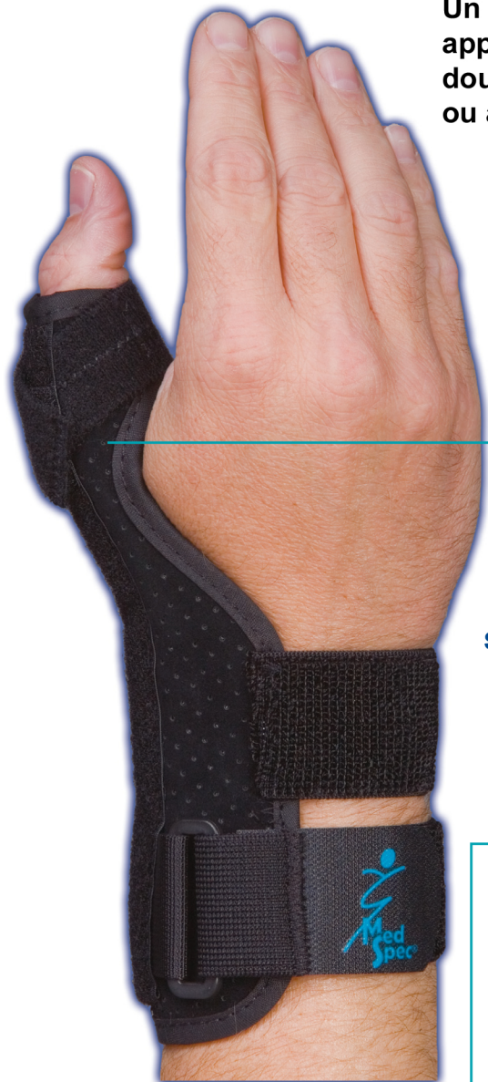
Support de pouce court

La courroie élastique intérieure et la courroie de fermeture externe fonctionnent ensemble pour permettre une fermeture facile et sécuritaire autour du pouce.