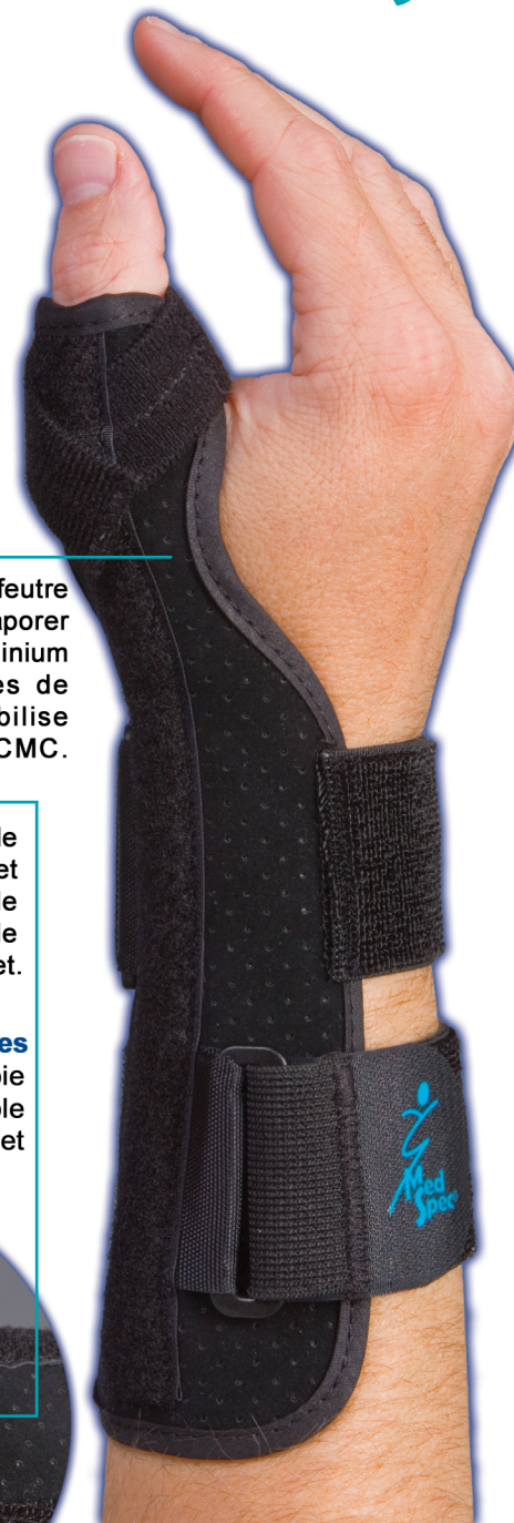
Support de pouce long